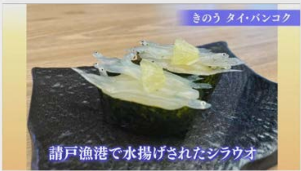
請戸漁港で水揚げされたシラウオ