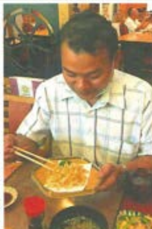
請戸産シラウオを食べる現地の人—タイ・バンコク